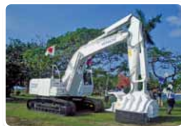
« Projet d'aide grâce à la fourniture d'équipements de déminage de mines antipersonnel, départements de Meta et Tolima », République de Colombie, année fiscale 2009