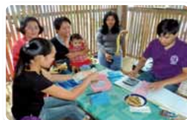
« Projet d'aide pour un fonds de microcrédits dans la province de Cotabato du Sud, île de Mindanao », République des Philippines, année fiscale 2010