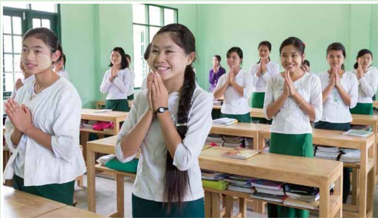
« Le Projet de construction d'un établissement d'enseignement primaire et secondaire à Kunlong, district de Kunlong, État Shan », République de l'Union du Myanmar, année fiscale 2013