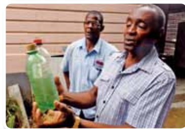
« Projet de formation des agriculteurs producteurs de café à la sécurité alimentaire et à la préservation de l'environnement », Jamaïque, année fiscale 2010