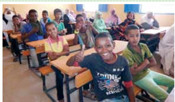
« Le Projet d'aménagement de l'école 1 de la commune de Chegar », République islamique de Mauritanie, année fiscale 2015

Au Japon, les Dons aux micro-projets locaux contribuant à la sécurité humaine sont ordinairement appelés « Kusanone », « Kusa » signifiant herbe et « Ne » racines.