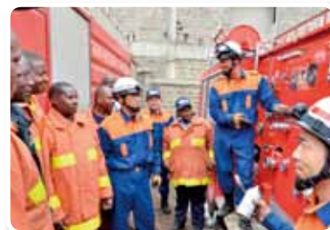
« Projet de réutilisation de véhicules de pompiers de seconde main dans le district de Nairobi », République du Kenya, année fiscale 2015