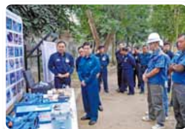
« Projet de réduction des frais d'eau payés dans le district du Nord Mayangon, région de Yangon », République de l'Union du Myanmar, année fiscale 2013