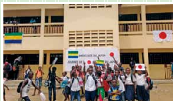
« Le Projet d'agrandissement et d'équipement de l'école publique des Charbonnages », République du Gabon, année fiscale 2013